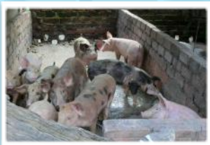
家で飼っている豚