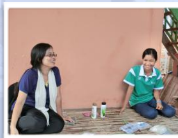
生活についてインタビューをしている様子

「私の家は、8人家族で、私は5人姉妹の3番目です。アルバイトはしていませんが、来年度から高校に通うつもりです。姉二人も高校まで出ており、一人は高校卒業後は服飾系の専門学校に通う予定です。飛び級で同じ学年の妹も、新学期からは同じ高校に通う予定です。父はアンコールトム内のお寺でお坊さんをしており、母は小学校で売店を出しながら米焼酎を作って売っています。生活で使用しているのは、井戸水です。家にある井戸から汲んだ水は、鉄のにおいがするため、水浴びや洗濯に使っています。料理に使う水や飲み水は、近所のアンコールクラウ小学校にある井戸から汲んできたものを使っています。こちらの水の方が浄化してあるためきれいで、安心して飲めるからです。将来の夢は、中学校の数学の先生になることです。」