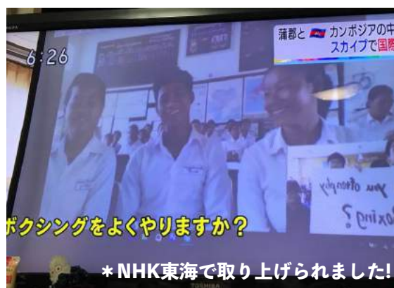
* NHK東海で取り上げられました!