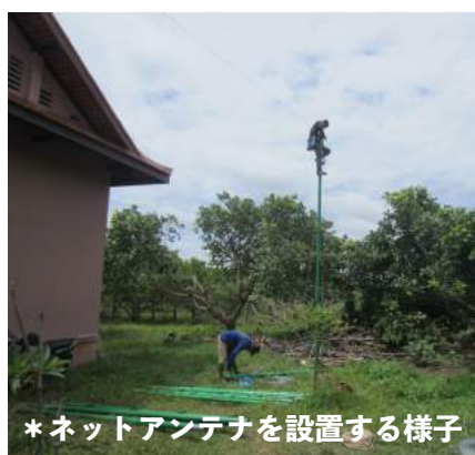
* ネットアンテナを設置する様子